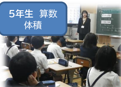
5年生 算数 体積