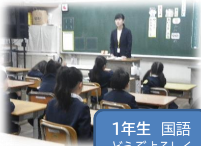
1年生 国語 どうぞよろしく