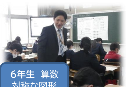
6年生 算数 対称な図形