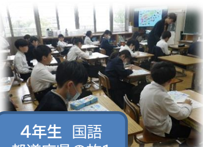
4年生 国語 都道府県の旅1