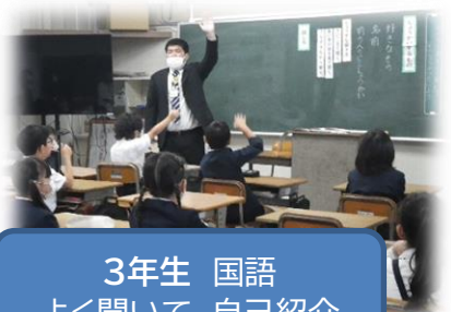
3年生 国語 よく聞いて、自己紹介