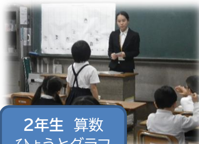
2年生 算数 ひょうとグラフ